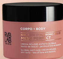
MESO PERFECT Przeciwstarzeniowy krem do ciała